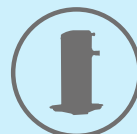
Compresor Scroll Invotech