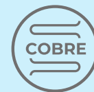
Tubería en Cobre - Aluminio

* Imagen de referencia, información sujeta a cambios.